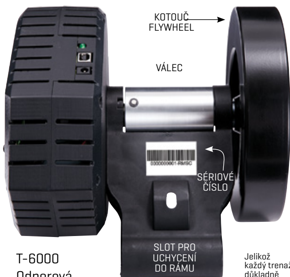
T-6000 Odporová jednotka

Jelikož každý trenažer důkladně testujeme, na válci mohou zůstat stopy po plášti.