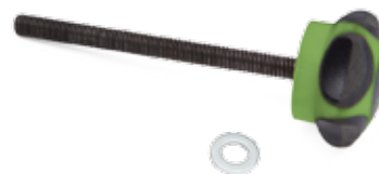
T-2202 Regulátor napětí s podložkou