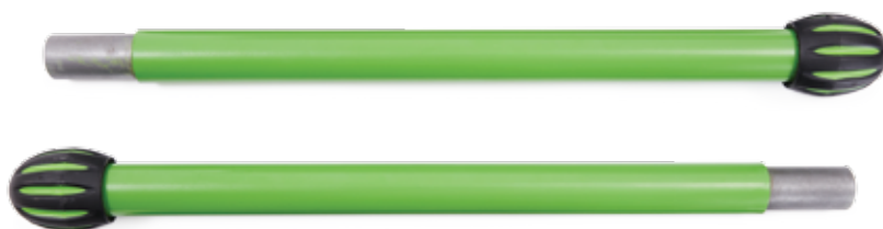
T-2303 Nohy rámu