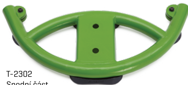
T-2302 Spodní část rámu