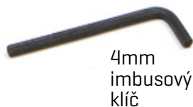
4mm imbusový klíč