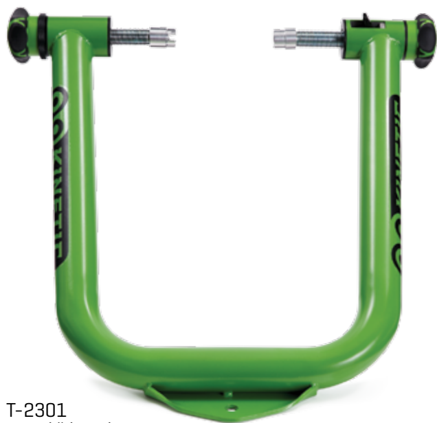
T-2301 Horní část rámu