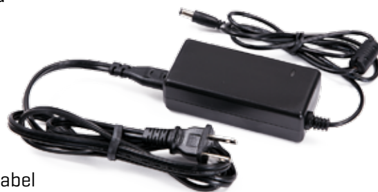
T-6018 Napájecí kabel

Jelikož každý trenažer důkladně testujeme, na válci mohou zůstat stopy po plášti.